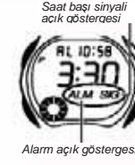
Alarm açık göstergesi