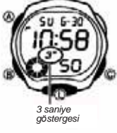
3 saniye göstergesi

LED (light-emitting diode) ve ışık öncü paneli karanlık ortamlarda ekran okuması için ekranı aydınlatır. * Diğer önemli bilgiler için "Ekran aydınlatması ile ilgili uyarılar"a bakınız.